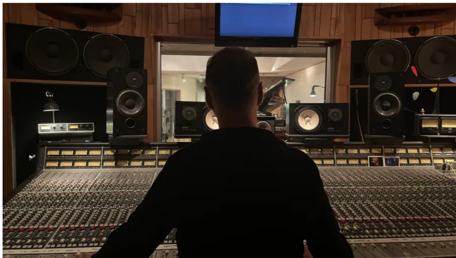
Etienne Daho au studio Motorbass, à Paris, lors de l'enregistrement de son album "Tirer la nuit sur les étoiles".

Son treizième album, Tirer la nuit sur les étoiles , Etienne Daho l'a enregistré entre Paris, Saint-Malo et Londres, au mythique studio Abbey Road. Daho, c'est d'abord une voix qui accompagne plusieurs générations depuis quarante ans. Une voix à la fois grave et légère et reconnaissable, surtout, entre toutes. Une voix qu'il ne cesse jamais de travailler, d'entraîner, comme dans ce studio parisien, l'automne dernier.