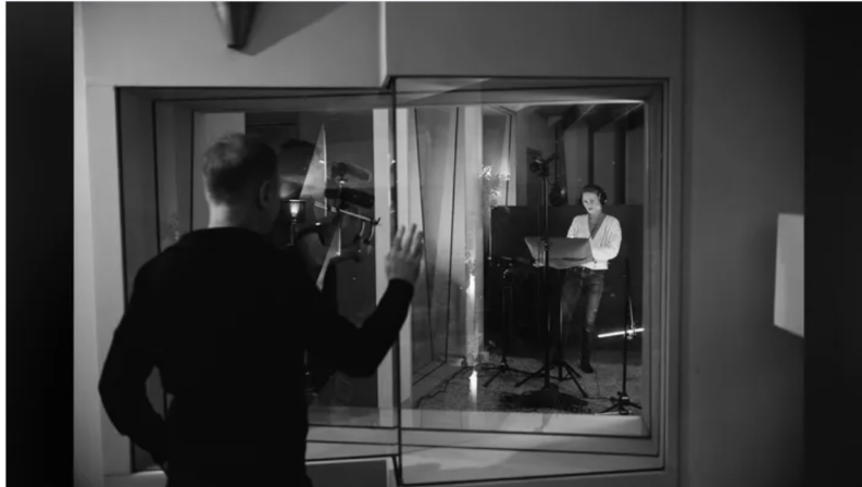
Etienne Daho et Vanessa Paradis lors de l'enregistrement de "Tirer la nuit sur les étoiles", la chanson qui donne son titre à l'album.

L'album célèbre la passion amoureuse sous toutes ses formes, dans un moment du monde bouleversé, chaotique. Avec un fil rouge. "Le désir, c'est le sel de la vie, en fait. Ce qui fait vous sentir très vivant. C'est la vie qui finalement contamine les chansons."