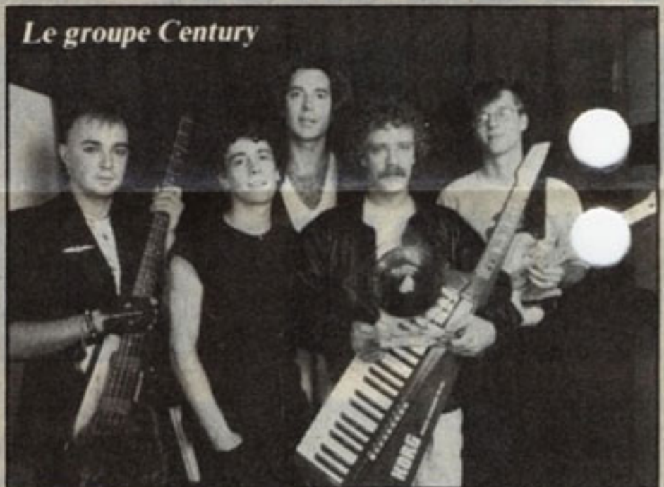
Le groupe Century