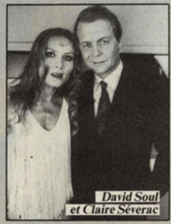
David Soul et Claire Séverac

que les Parisiens. Notre photographe malin a réussi à faire des clichés de tous les participants dans les coulisses. Unique exception à la règle : les membres de Depeche Mode, trop occupés, semble-t-il, à boire de la bière, pour s'occuper des journalistes et de leurs fans et poser en dehors de leur passage sur scène. Hormis ce petit incident de parcours, la soirée a véritablement été un triomphe. Imaginez : tous les numéros 1 étaient présents sur la même scène. Un plateau exceptionnel ! Dernier détail rigolo : dans les coulisses, on a bien failli oublier que nous étions en plein cœur de Paris, car la plupart des artistes italiens s'interpellaient et conversaient gaiement dans leur langue nationale. Il n'y a pas à dire, ils ont bien le vent en poupe nos « cousins » en ce moment. Ciao !