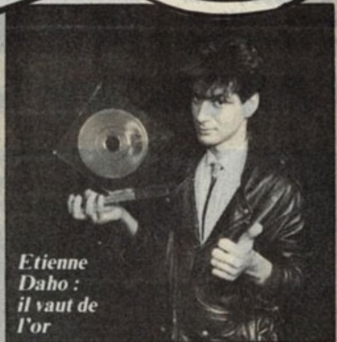
Etienne Daho : il vaut de l'or