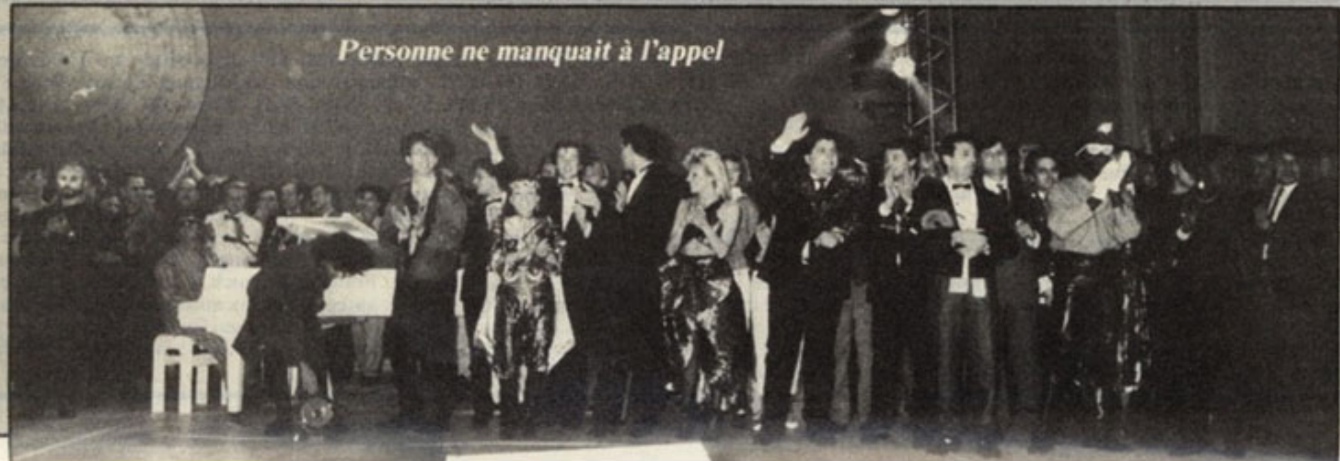
Personne ne manquait à l'appel