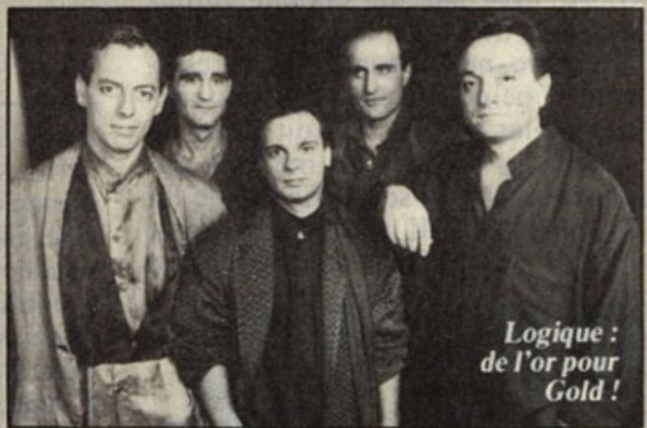
Logique : de l'or pour Gold !