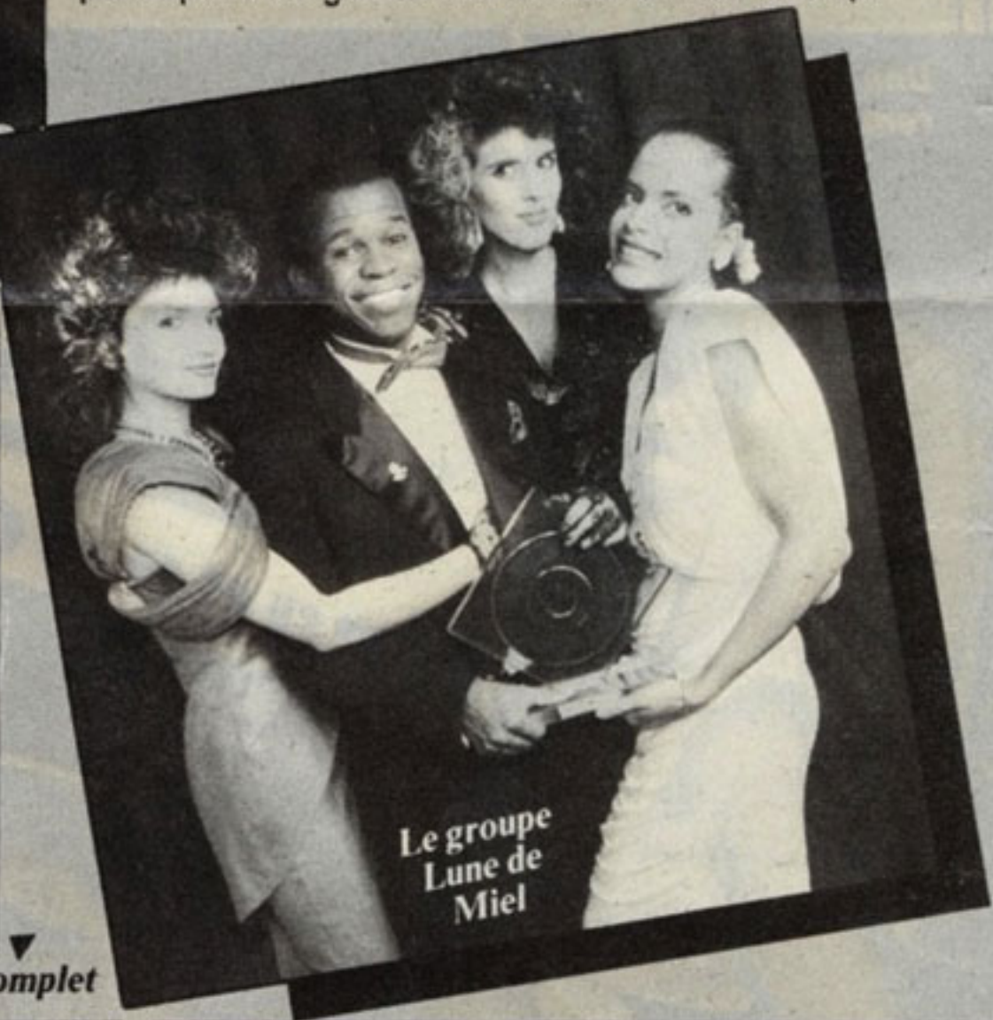
Le groupe Lune de Miel