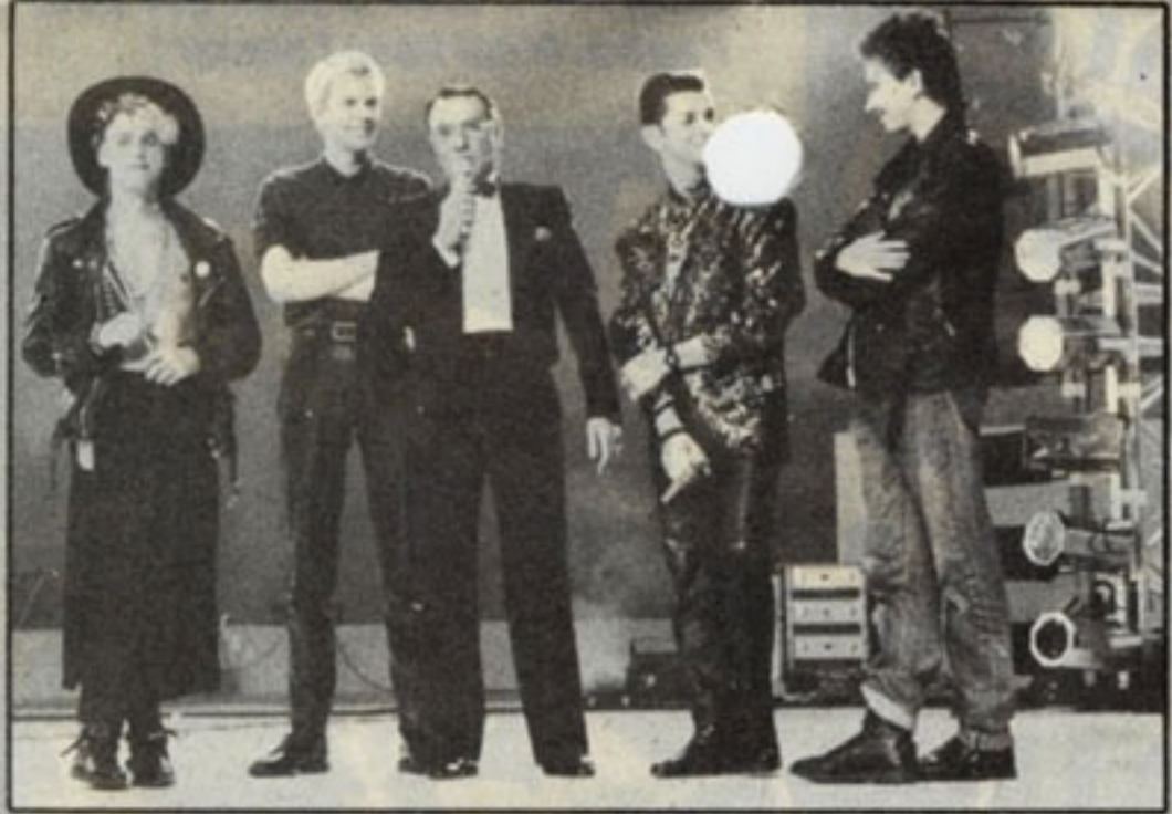
Depeche Mode au complet