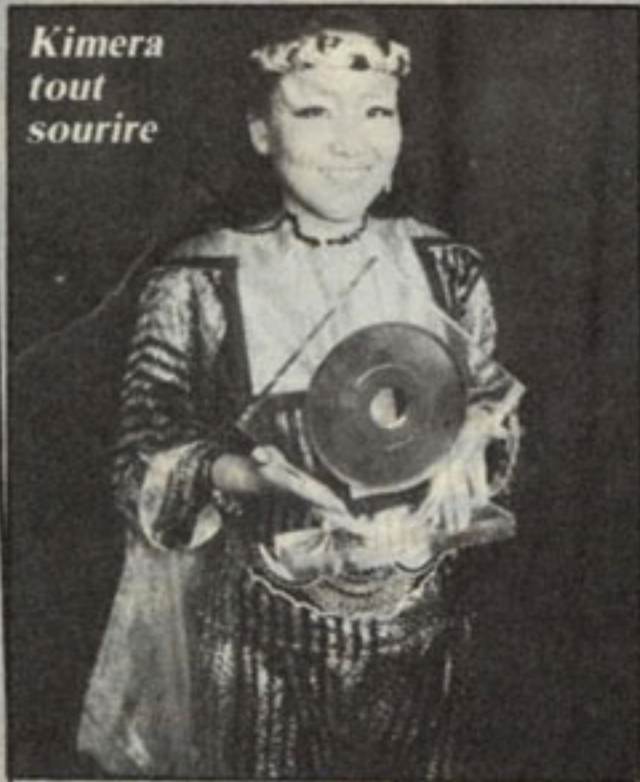
Kimera tout sourire