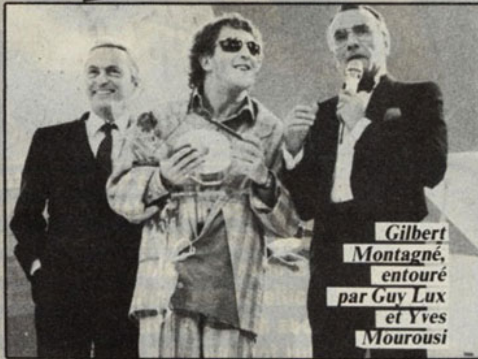
Gilbert Montagné, entouré par Guy Lux et Yves Mourousi