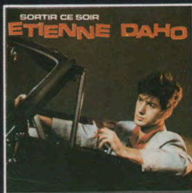
45t 90068 SORTIR CE SOIR SAINT-LUNAIRE DIMANCHE MATIN