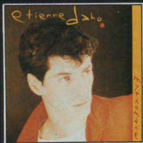
33t 70170 MYTHOMANE