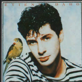
33t 70232 MC 50232 LA NOTTE, LA NOTTE...