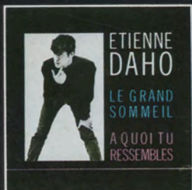
45t 90058 LE GRAND SOMMEIL A QUOI TU RESSEMBLES